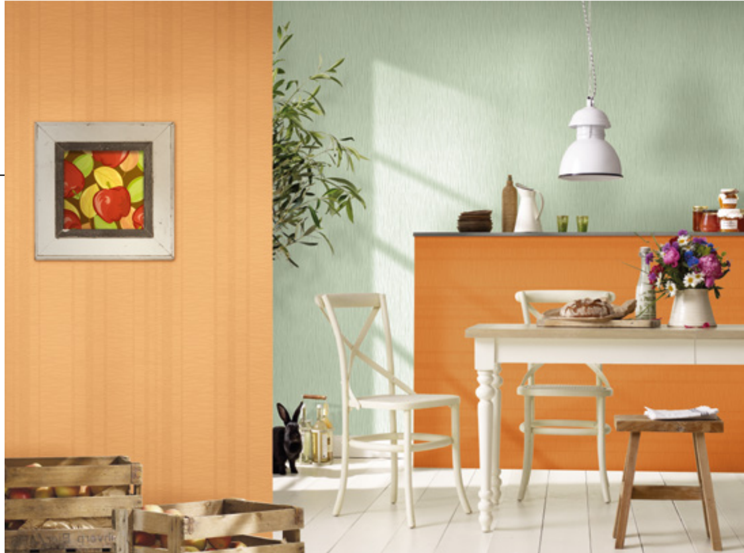
Tapeten PatentDecor | Nr. 15268 / Nr. 15270