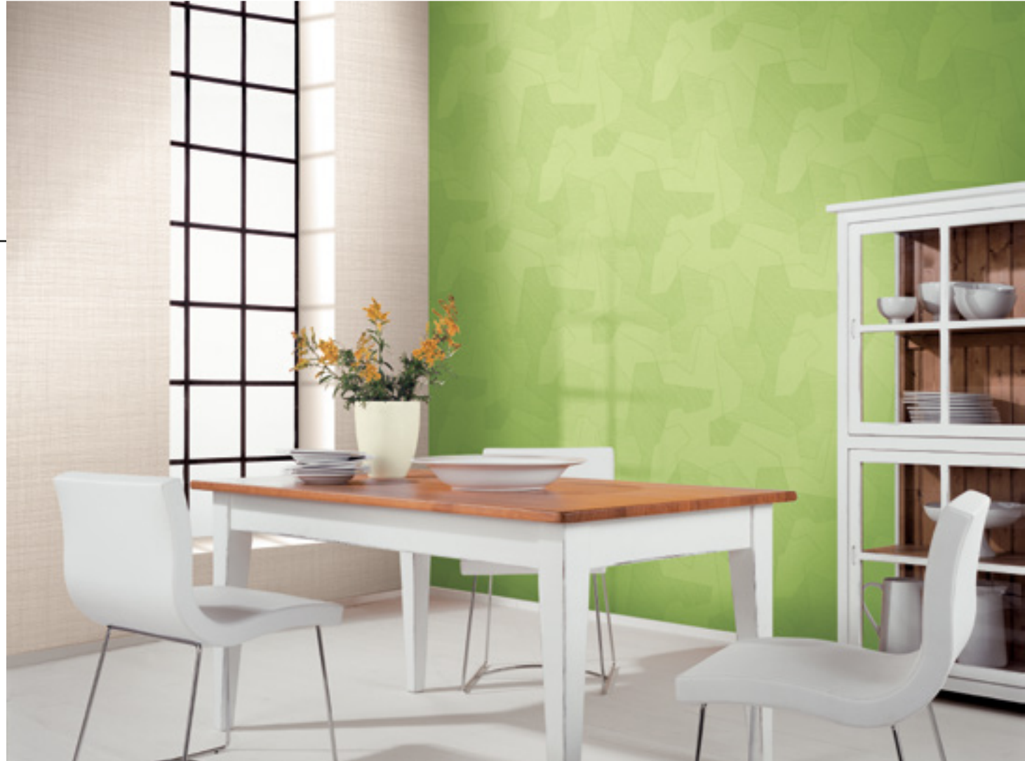
Tapeten PatentDecor | Nr. 15036