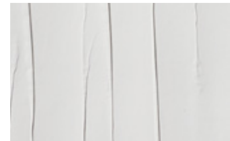
Tapeten PatentDecor | Nr. 15200