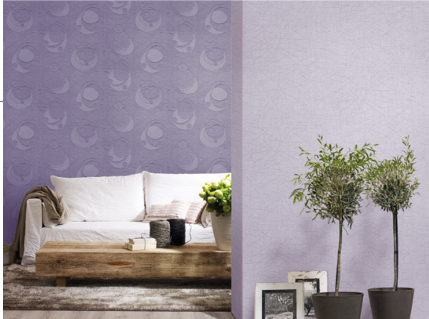
Tapeten PatentDecor | Nr. I5306 / Nr. I5307