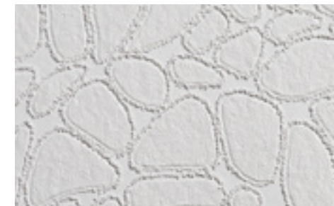
Tapeten PatentDecor | Nr. I5310