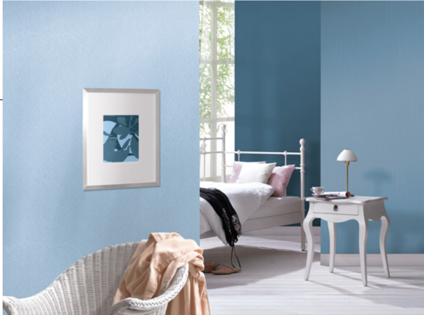
Tapeten PatentDecor | Nr. 15203 / Nr. 15204