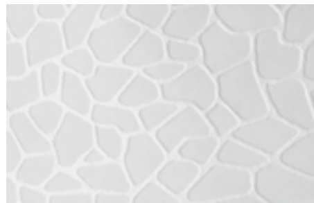
Tapeten PatentDecor | Nr. 15272