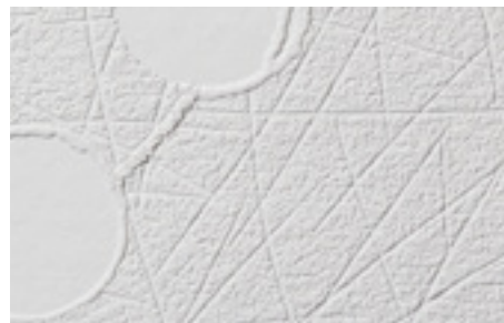
Tapeten PatentDecor | Nr. I5306