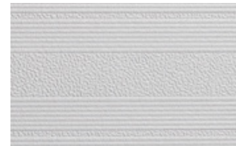
Tapeten PatentDecor | Nr. 15283