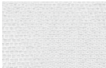
Tapeten PatentDecor | Nr. 15238